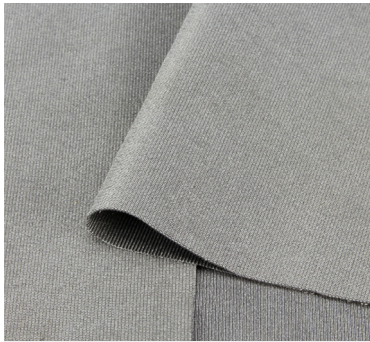
◀ 1 cm ▶ PRONatur24 Silver-Elastic

Dehnbarer vollversilberter Elastanstoff zum Nähen von Bekleidung. Angenehmes Hautgefühl. Silber. 50 dB. Breite 160 cm.