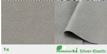
1x PRONatur24 Silver-Elastic